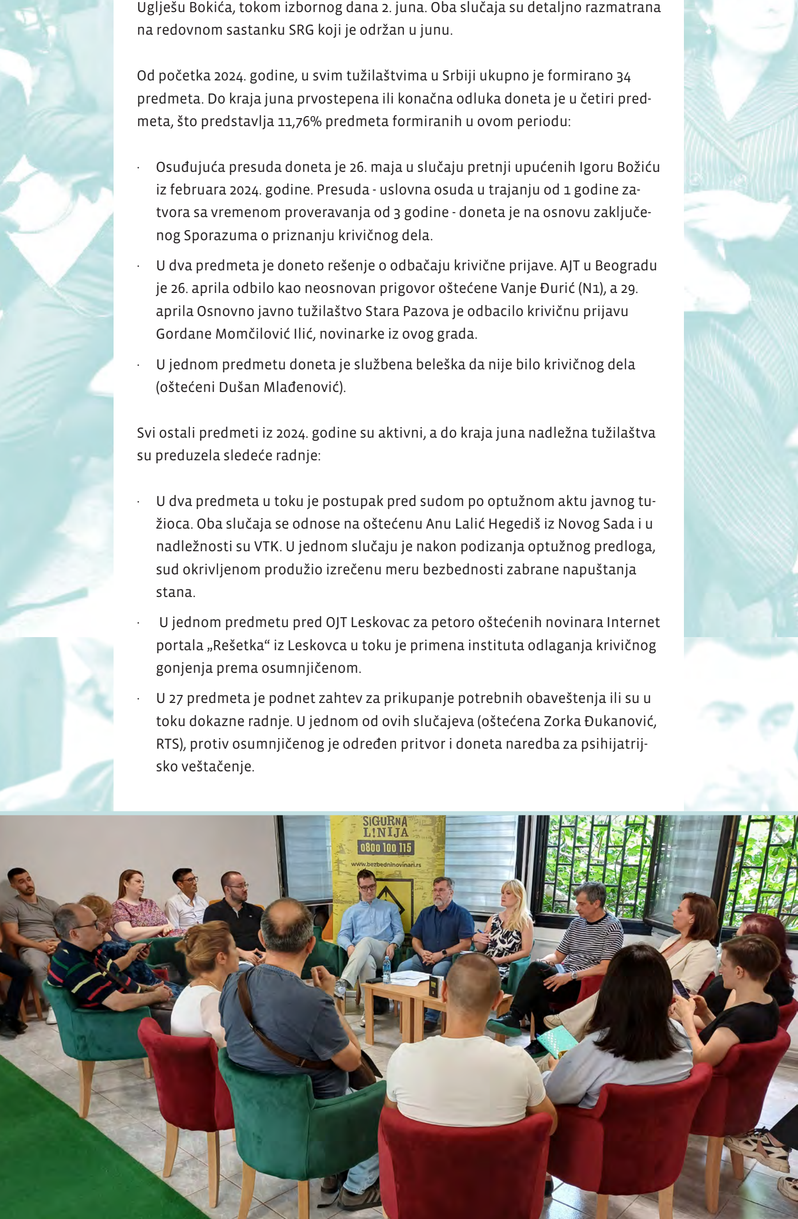
Tatjana Vasilević, Veikjovik predstavnik Vrhovnog javnog tužilaštva na sastanku SRG

Kao i u prethodnom periodu, i dalje dominiraju slučajevi pred Posebnim javnim tužilaštvom za visoko-tehnoški kriminal (VTK). Međutim, procenat predmeta pred VTK je u ovom periodu smanjen, dok je povećan pred ostalim tužilaštvima – osam predmeta je u nadležnosti AJT (57,2%), dok je u Novom Sadu (21,4%) u nadležnosti tužilaštava sa područja AJT u Beogradu i u Potvrzima. U prethodnom kvartalu, u periodu od januara do aprila, 70% predmeta bilo je u nadležnosti VTK. Ovaj podatak ukazuje da je došlo do izvesnog pomeranja napada na novinare iz virtuelne u realnu sferu.